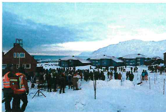
Bilde 4: Sanitetsvakt på Ta Sjansen 2020.

Av smittevern hensyn ble samtlige storøvelser avlyst. Gruppene har likevel fått arrangert mindre øvelser internt i gruppene. Skredgruppa og Breggruppa har også hatt mindre øvelser med SMS og Lufttransport. Hjelpekorpsset har deltatt med markører til Lufttransport.