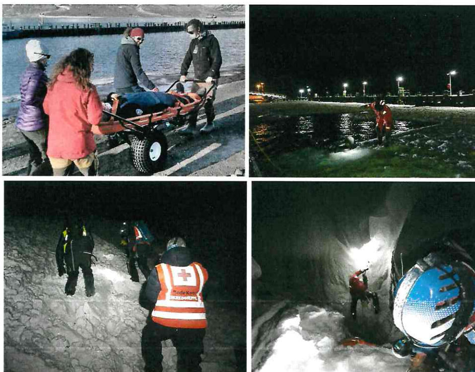
Bilde 2: (Fra topp, venstre) Innsatsgruppa trener på smittevern og bruk av ny pasientbåre ; Trening på selvredning på sjøis ; Skredgruppa og innsatsgruppa på samøvelse ; Bregruppa i isgrotta.