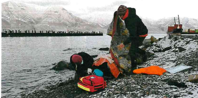
Bilde 5: Til tross for restriksjoner er beredskapen blitt opprettholdt.