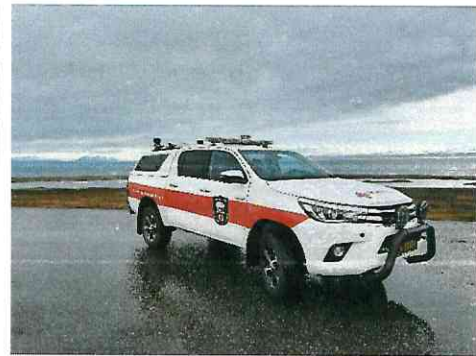
Bilde 6: Ny pasientsluffe og ny bil ble kjøpt inn i 2020 og representerer en solid oppgradering av utstyrsparken vår.

Det er også gjort en del endringer på depot. Bregruppas utstyr ble flyttet til hall nummer 2 og alle sledene er flyttet ut i en 20-fot container som ble kjøpt inn i løpet av høsten. Et stort nytt kart med pleksiglass utenpå har kommet på plass i inngangsområdet. I 2.etg har vi skiftet ut bordene i kursrommet med nye, mindre bord. Dette gjør det enklere å tilpasse undervisning med tanke på avstand og smittevern.