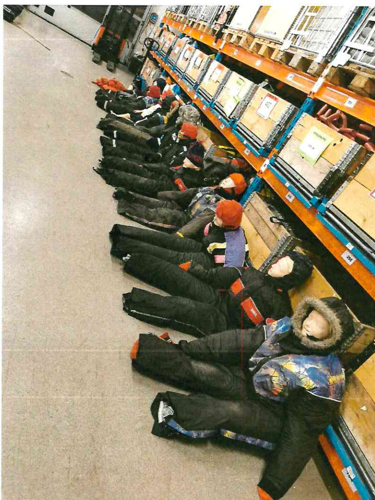
Bilde 1: Covid-19 vennlige markører under avsluttende øvelse VFØR