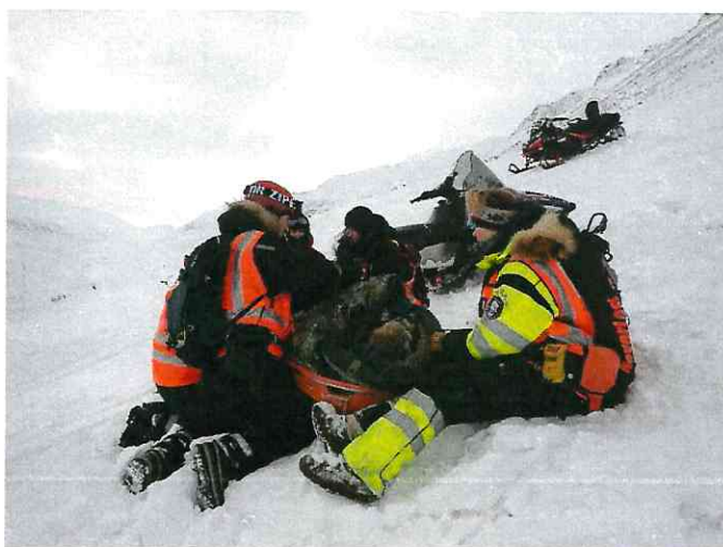
Bilde 7: Pasientbehandling under kvalifisert snøskuterkursset.