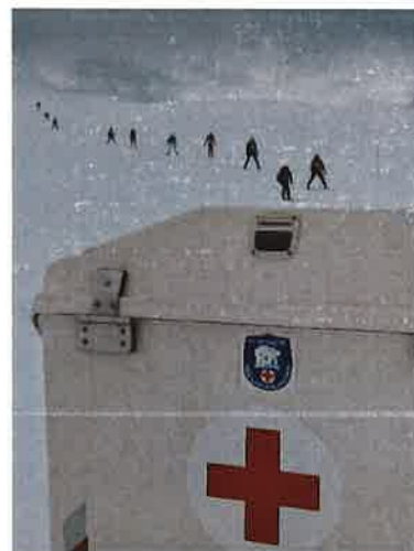
Sanitetsvakt ved Spitsbergen skimaraton.