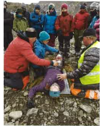
Førstehjelpsøvelse på Camp Svalbard.