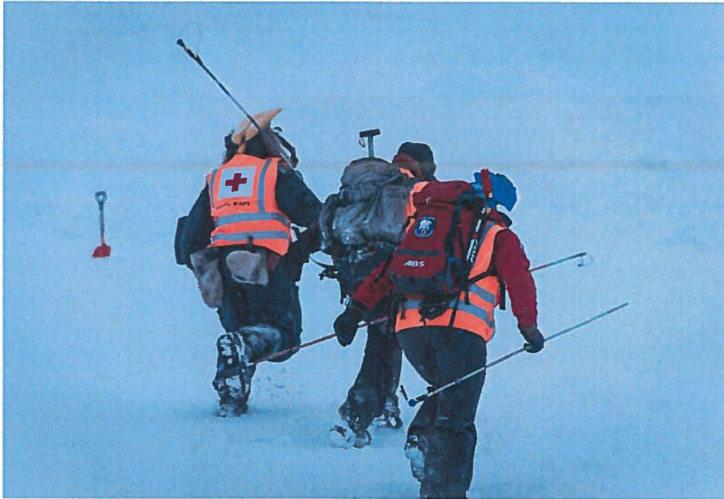
Fra samøvelse skred.

Mediumbreen. Tre medlemmer fra skredgruppa har deltatt på metodekurs skred som ble arrangert i Longyearbyen og et av medlemmene deltok på Finsekurset. Vi har hatt en deltager på henholdsvis metodesamling i Skjåk og Nordisk Konferanse om snøskred og friluftsliv på Åndalsnes. Medlemmer fra skredgruppa har holdt innlegg på skredseminar i Tromsø i regi av CARE prosjektet (snøskredprosjekt, UiT) og under metodesamling i Skjåk. Skredgruppas medlemmer har også bidratt med opplæring av egne medlemmer i hjelpekorpsset og for «Ut og kjør». Flere av medlemmene i gruppa er aktive som snøobservatører i regi av NVE og leverer ukentlig observasjoner til varselet på varsom.no, dette er med på å styrke og øke kompetansen i gruppa.