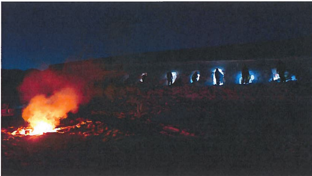
Fra KSOR helgen i Reindalen.

I 2016 forandret LRKH grunnutdanningen og følger nå grunnutdanningen fra Norges Røde Kors. I tillegg til kursene som inngår i denne, har vi en Svalbardmodul som omhandler tema som er relevante for medlemmer av hjelpekorpsset på Svalbard. Her får medlemmene opplæring i blant annet isbjørnsikkerhet, meteorologi på Svalbard, scooter og slede, kart, kompass og GPS. For å fullføre grunnutdanningen må medlemmene delta på alle medlemsmøter (med maks. 4 fravær). Medlemmer som har fullført grunnutdanningen blir medlemmer i Hjelpekorpsset og kan fortsette utdanningsstigen i korpsset.