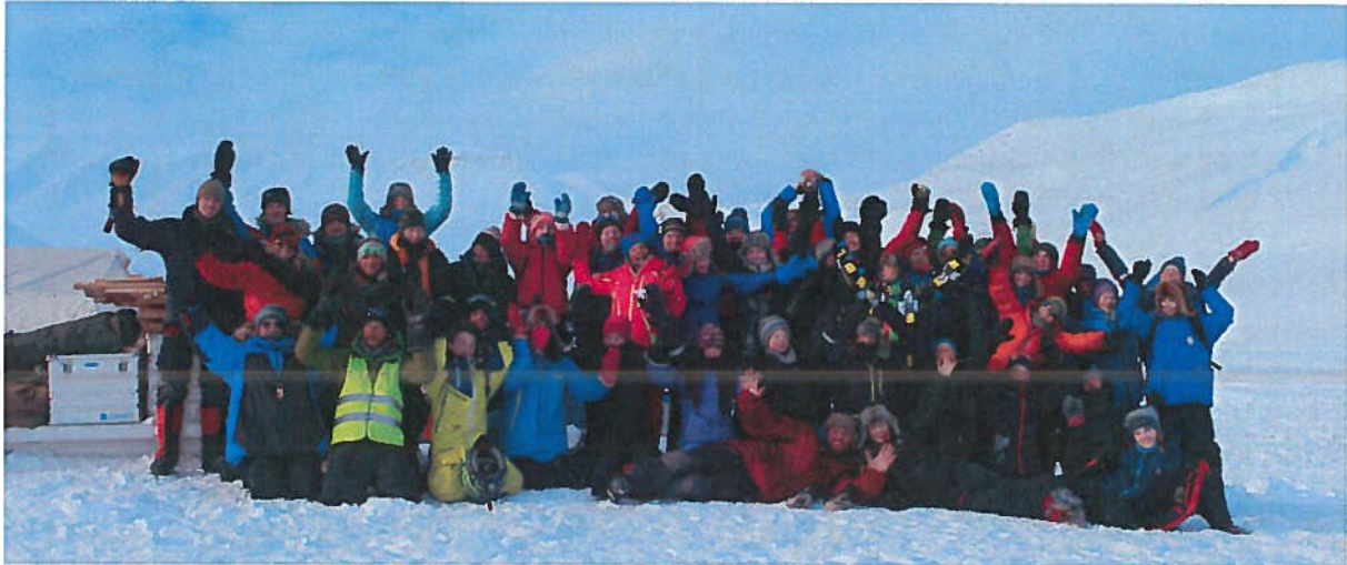
Deltakere på Camp Svalbard Vinter.

Camp Svalbard Vinter ble arrangert ved Tellbreen i april. Det var 31 ungdommer som deltok på denne. LRKH bidro med førstehjelpskurs.