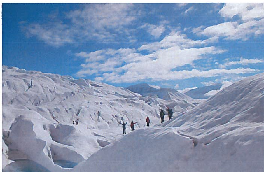
Brekurs på Nordenskiöldbreen.

I 2017 har LRKH vært arrangør eller deltatt med instruktører for følgende eksterne kurs: