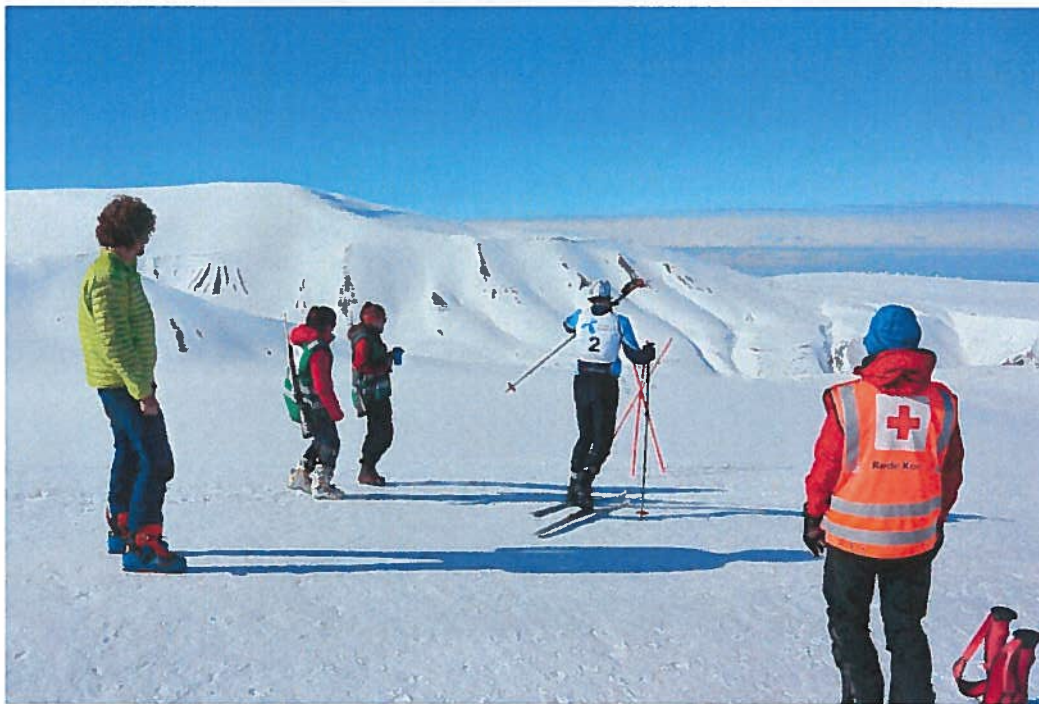
Sanitetsvakt under Spitsbergen Up'n Down.

Året 2017 har gitt oss mange ulike erfaringer. Av de større utfordringene vi har stått ovenfor, var snøskredet som gikk i byen den 21. februar. Som bistand til skredgruppa, som stod for faglig ledelse og koordinering, stilte hjelpekorpsset mannsterke for å bistå med søk i skredområdet. Videre gikk det slag i slag med utkallinger til observerte utløste skred, men vi slapp heldigvis å oppleve mennesker bli skadet eller omkomme i skred dette året. Hjelpekorpsset har også opplevd et år med uvanlig mye barmarkssøk, noe som har gjort oss mer bevisst på hvilke utfordringer vi står ovenfor når man ikke har mulighet til å benytte snøskuter i ettersøk, og man ser hvor store områder vi må dekke til fots. Hjelpekorpsset har også bistått sterkt i etterkant av helikopterulykka der et russisk helikopter gikk ned. Som en uerstattelig ressurs i letarbeidet, samt erfaring med trygg forflytting i felt, har hjelpekorpsset bistått både russiske og norske letemannskap i å søke etter omkomne.