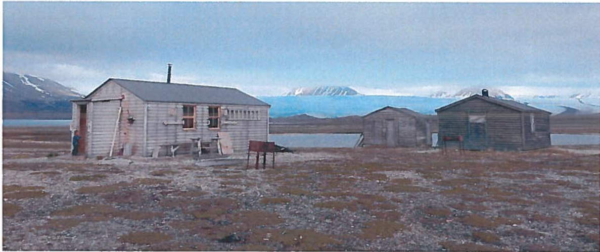
Hytta i Brucebyen.

LRKH disponerer to hytter, vi eier Reindalshytta og låner en hytte i Brucebyen av Staten ved Sysselmannen på Svalbard. Reindalshytta ligger omtrent midtveis mellom Longyearbyen og Svea og var tidligere mye brukt som beredskapshytte. I dag brukes den til rekreasjon for fastboende medlemmer og som utgangspunkt for KSOR vinter. Hytta er godt brukt i vintersesongen. På grunn av beliggenheten blir den lite brukt utenom skutersesongen. I 2017 ble hytta vasket ned og klargjort for vinteren. Det er over de siste årene gjort en stor innsats for å rydde uteområdet rundt hytta og i boden. Det siste av søppel er kjørt på avfallsmottaket og uteområdet ser nå fint og ryddig ut, også på sommeren.