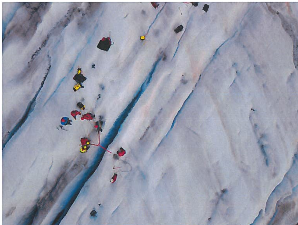
Rigging av trefot under samøvelse bre.

Bregruppa har ikke vært involvert i redningsaksjoner på bre i løpet av året 2017, men bidro med sin kunnskap ved redning i bratt lende på Fuglefjella i september.