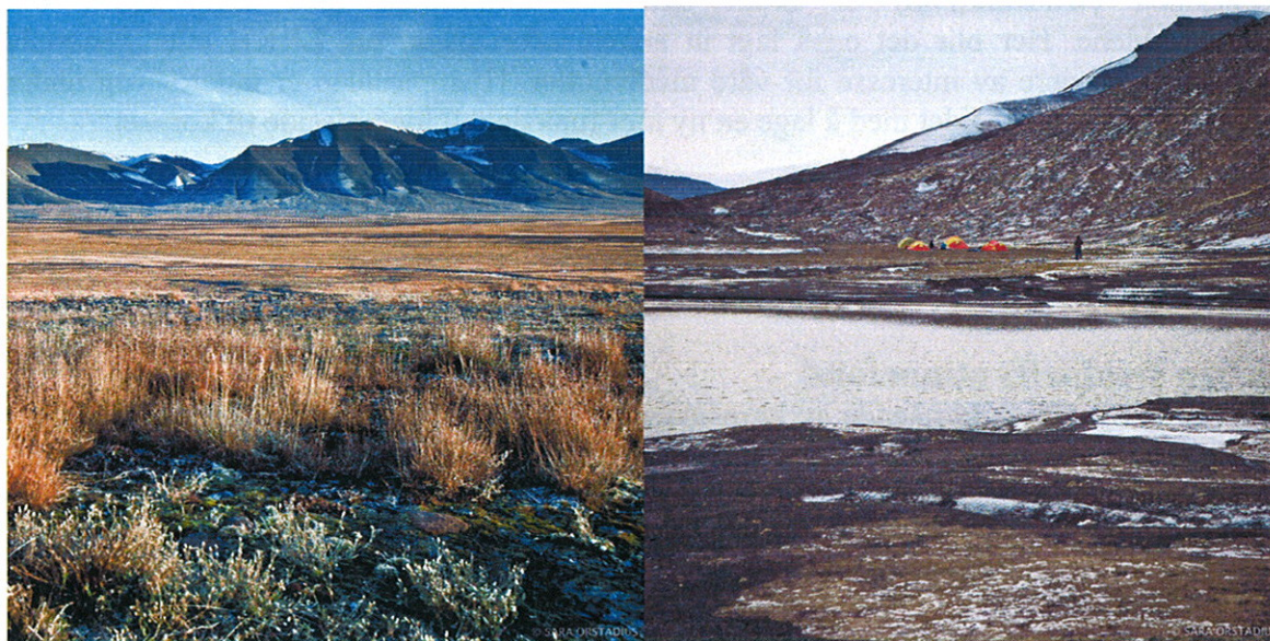
Dugnadstur til Reindalen i september. Reindalen og Bolterskaret.

LRKH eier en hytte i Reindalen og har låneavtale med staten på en hytte i Brucebyen. På Reindalshytta har det i løpet av året blitt satt opp vegg bak brannmuren og store mengder avfall er samlet sammen og transportert inn til byen. Reindalshytta ble også rundvaska på en dugnadstur i høst. Hytta i Brucebyen er fortsatt ikke bruksklar, men har ved fem anledninger blitt besøkt av snekker fra Sysselmannen, samt materialforvalter og andre frivillige fra LRKH. Følgende har blitt gjort: Pipe og pipegjennomføringen er flyttet, brannmur er satt opp bak pipa, grind og rist foran inngangsdøren, håndtak på dører, vedkasse, yttergang tettet, to nye senger og stormkasser på lufteventiler. Det er også transportert ut materialer, madrasser og diverse inventar. Nye vinduer som kan åpnes er bestilt og planlagt montert før påska 2016. Når disse er på plass er hytta klar til bruk. Det er også tatt mål og lagt en plan om utbygg med toalett, tilsvarende det som var på den gamle hytta før denne brant ned. Det er inngått en avtale om bruk av toalettet til Sysselmannen frem til utbygget er på plass.