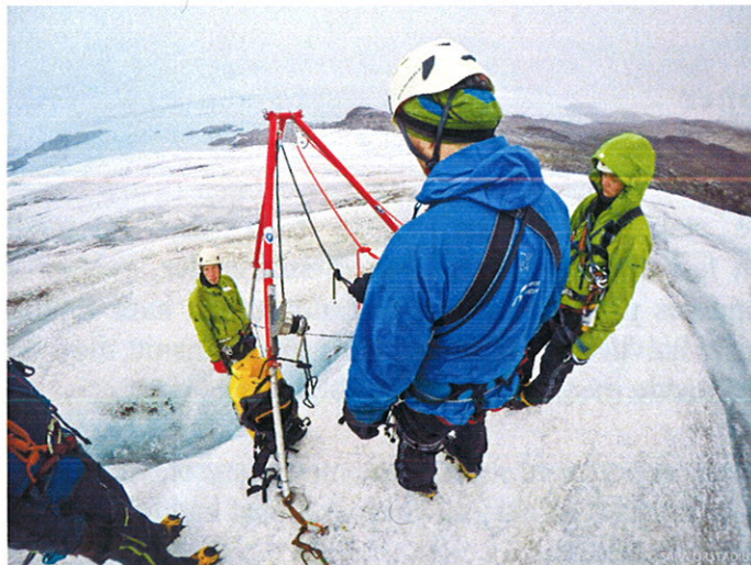
Samøvelse med Sysselmannen og Luftransport på Nordenskiöldbreen.