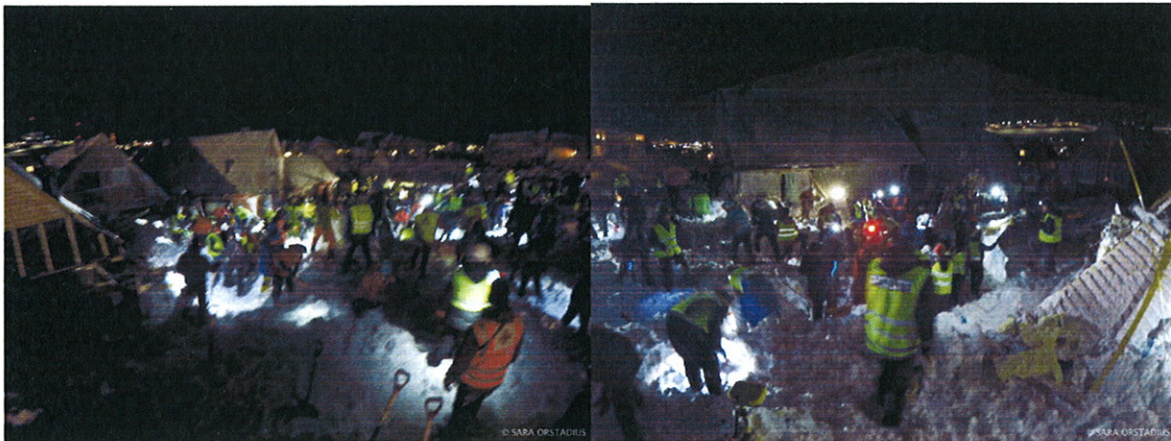
Redningsarbeide 19 desember.

19. desember: Skred fra Sukkertoppen. Det deltok ca 150 lokale i redningsarbeidet denne dagen. I tillegg fikk vi bistand fra fastlandet der ressurser fra Troms Røde Kors, Norsk folkehjelp, Norske Redningshunder og Politihund som kom opp lørdag kveld og ble et døgn. Julen 2015 ble preget av skredet fra Sukkertoppen. I perioden 19.-29. desember ble det nedlagt ca 1800 timer innsats i selve redningsarbeidet etter skredet, administrativt arbeid /oppfølging og vakthold i forbindelse med ferdselsforbudet på grunn av vedvarende skredfare. LRKH fikk god bistand fra Longyearbyens befolkning som stilte opp i forbindelse med vakthold gjennom julen og romjulen. LRKH har hatt ett tett samarbeid med Sysselemannen på Svalbard, Longyearbyen lokalstyre, Svalbard kirke og Longyearbyen Sykehus med hyppige møter og fokus på oppfølging av innbyggere etter skredet.