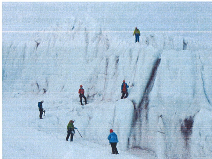
Brekurs på Nordenskiöldbreen.