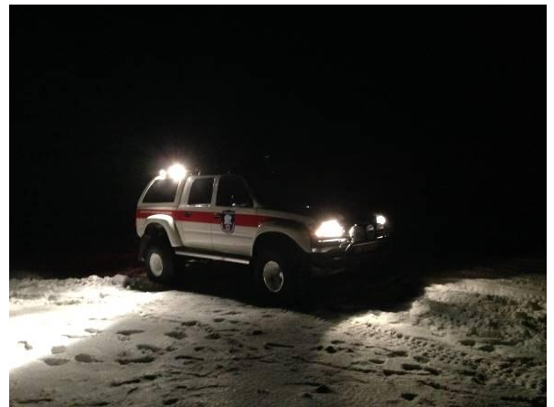
Øvelsekjøring med Arctic Truck.

Hjelpekorpsset har fulgt en lignende aktivitetsplan fra tidligere år med faste medlemskvelder, kurs og øvelser. Medlemskveldene har hatt følgende tema: Søk i terrenget, repetisjon førstehjelp, VHF og samband, intro til skadesminke, kart - kompass og GPS, introduksjon til Arctic truck. I desember ble det arrangert en sosial kveld i Basecamps gamle ute i Adventdalen. I januar 2013 var det Kvittkortkurs med 12 deltakere. I februar var det skredkurs med 10 deltakere og skredworkshop med 8 deltakere. Høsten 2013 avholdes videregående førstehjelpskurs med 9 deltagere og veilederkurs med 12 deltakere. Ved utgangen av 2013 ble det opprettet en bilgruppe som har ansvar for vedlikehold og utstyring av LRKHs Arctic truck.