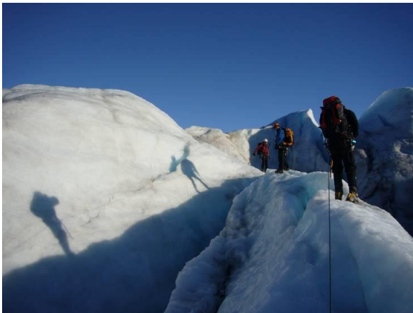
Samøvelse med Sysselmannen på Nordenskiöldbreen i september.

Gruppa har 13 medlemmer, herav 4 aspiranter. Gruppeleder er Sigmund Andersen.