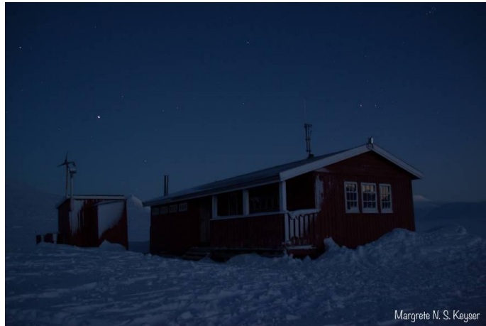
Reindalshytta i mørketiden.

LRKH eier en hytte i Reindalen og låner to hytter av staten, Nordenskiöldhytta på Nordenskiöldtoppen og en hytte i Brucebyen. På årsmøtet i 2013 ble det bestemt at LRKH skulle si fra seg Nordenskiöldhytta. Reindalshytta blir leid ut til LRKH sine medlemmer. I september 2013 ble Vinter B sin årlige helgetur til hytta arrangert, 11 personer deltok. Det er ikke gjort vedlikehold på denne hytta i 2013, men det er planlagt å legge ny papp på resten av taket, bytte ovnene og gjøre nødvendig vask og vedlikehold i 2014. I 2013 ble det satt ned et nytt hytteutvalg som består av to personer fra styret. Hytteutvalget arbeider aktivt med Reindalshytta. Etter brannen i Brucebyen i 2010 er det bygget opp en kopi av hytta i Brucebyen som brant. Sysselmannen har foreslått at LRKH skal få tilgang til denne hytta, men ordningen om utleie av statens hytter er under revidering, slik at dette ikke er helt avklart enda.