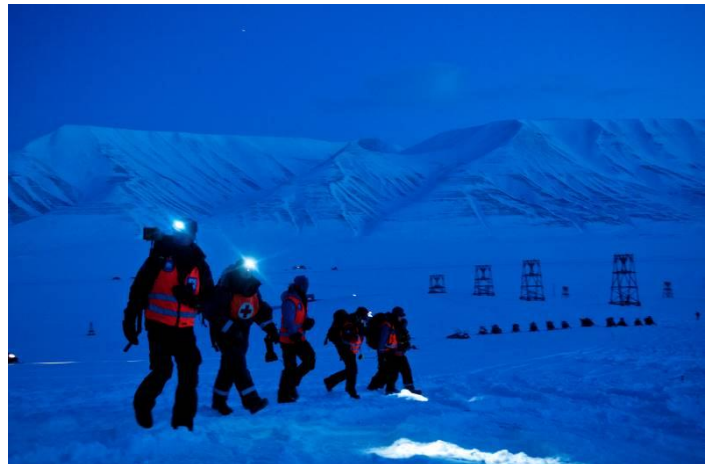
Samøvelse med Sysselmannen, Airlift og Sykehuset i februar.

Gruppa ble utkalt til aksjon ved passet ved Longyearbreen. Gruppa rykte ut, men det viste seg at det ikke hadde gått skred.