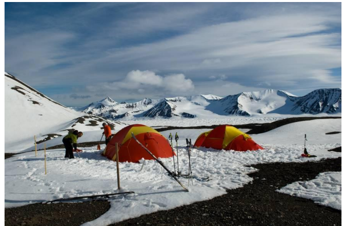
Samøvelse med bregruppa og skredgruppa ved Mediumfjellet i juni.