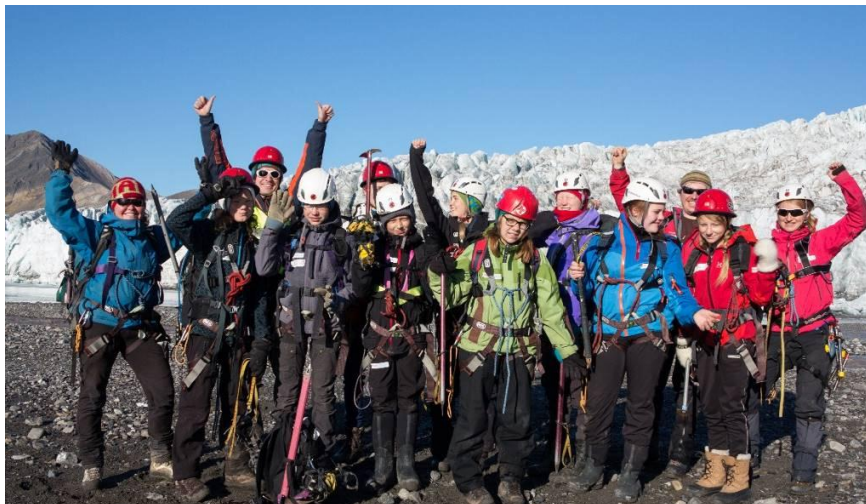
Camp Svalbard: Ungdommer på brevandring med instruktører fra LRKH.

For første gang planlegges et Vinter Camp Svalbard, som skal være 14-16 mars 2014 og inneholde vinteraktiviteter som hundekjøring og ski. Planleggingsgruppa består av representanter fra LRKH, ANG og LL. Vi tester et opplegg i mindre skala første året med 16 plasser for ungdommene, for å eventuelt utvide til neste år.