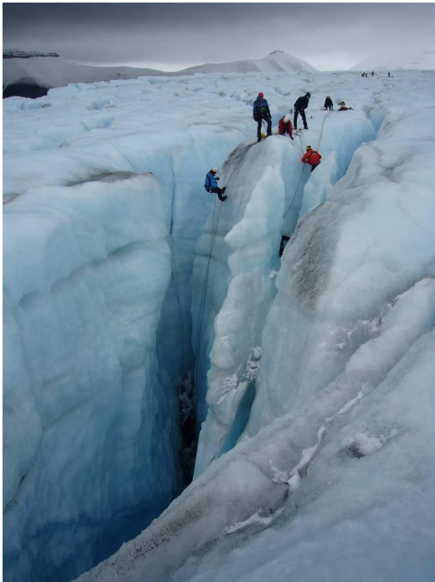
Samøvelse med Sysselmannen på Nordenskiöldbreen i september.