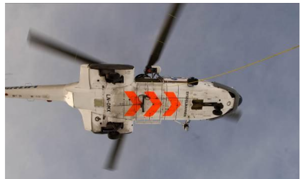
Super Pumaen under øvelse til bregruppa i mars 2013.