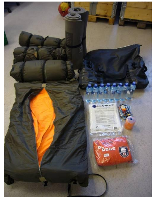
Innhold beredskapsenhet.

LRKH har et godt samarbeid med alle aktuelle samarbeidspartnere på Svalbard og med Norsk Luftambulans (NLA).